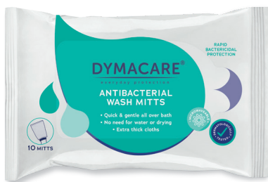
ART.-NR. DY401 | 10 Waschhandschuhe/Pkg | 30 Pkg/Karton