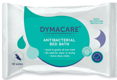
ART.-NR. DY 201 | 10 Tücher/Pkg | 30 Pkg/Karton