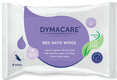
ART.-NR. DY 200F | 8 Tücher/Pkg | 30 Pkg/Karton