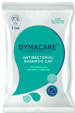
ART.-NR. DY 301 | 1 Shampoo Cap/Pkg30 Pkg/Karton