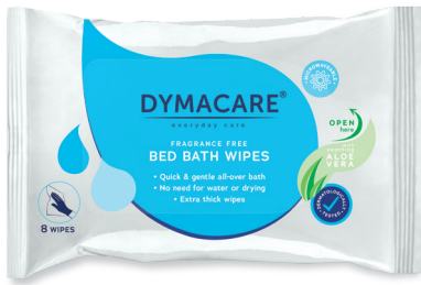
ART.-NR. DY 200 | 8 Tücher/Pkg | 30 Pkg/Karton