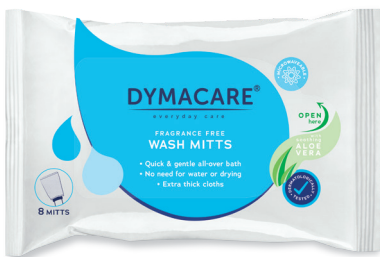
ART.-NR. DY 400 | 8 Waschhandschuhe/Pkg 30 Pkg/Karton