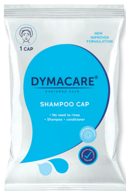
ART.-NR. DY 300 | 1 Shampoo Cap/Pkg | 30 Pkg/Karton